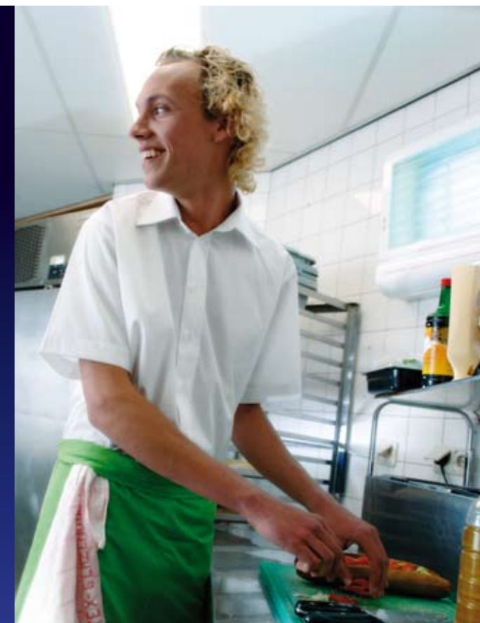
Tekst: Camilla Hut